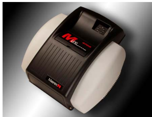
M-LINE 4700 Force de 700 Newtons