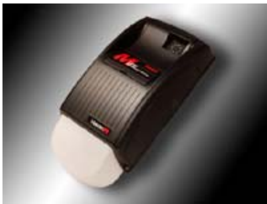
M-LINE 4500 Force de 500 Newtons